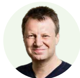
Lars Baadsgaards tre vigtigste råd om investering