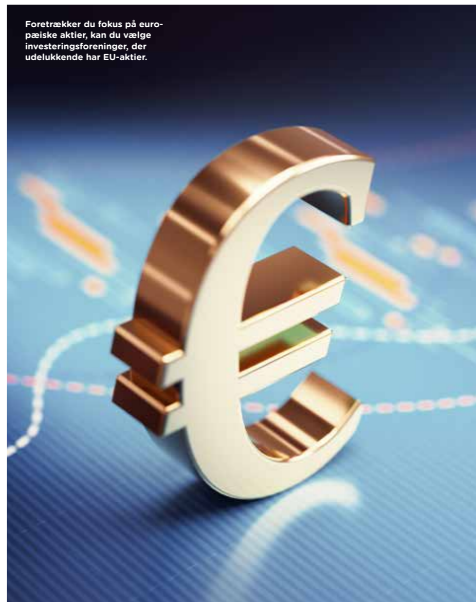
Foretrækker du fokus på europæiske aktier, kan du vælge investeringsforeninger, der udelukkende har EU-aktier.

Gennemsnittet af ÅOP for de 22 investerings-